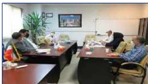
جلسه تجهیزات پزشکی با حضور معاون غذا و دارو و سرپرست اداره تجهیزات پزشکی در بیمارستان کوثر ۱۴۰۱/۰۲/۱۸