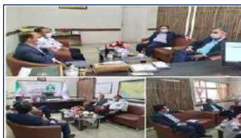
برگزاری جلسه مشترک با شهردار ایوان کی در شبکه بهداشت و درمان شهرستان گرمسار ۱۴۰۱/۰۲/۲۱