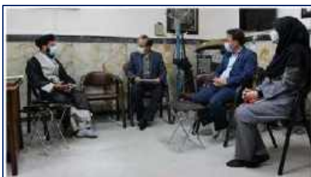
دیدار سرپرست شبکه بهداشت و درمان شهرستان گرمسار با امام جمعه شهرستان به مناسبت هفته سلامت ۱۴۰۱/۰۲/۱۷