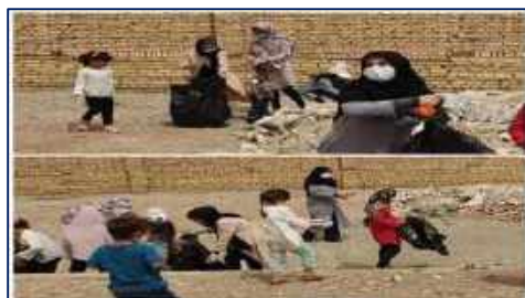
برگزاری پویش پاک سازی محیط به همت بهورز خانه بهداشت زنده یاد الهام قباخلو در شهرک صنعتی ایوان کی شهرستان گرمسار ۱۴۰۱/۰۲/۲۱