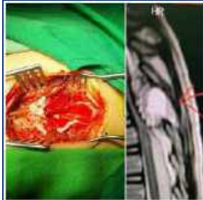
عمل جراحی موفقیت آمیز کودک ۶ ساله با ضعف اندام تحتانی در مرکز آموزشی، پژوهشی و درمانی کوثر ۱۴۰۱/۰۲/۱۱