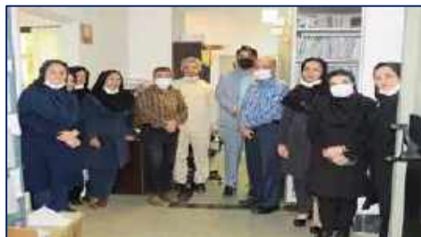
بزرگداشت روز اسناد ملی و مدارک پزشکی در مرکز آموزشی پژوهشی و درمانی کوثر ۱۴۰۱/۰۲/۲۱