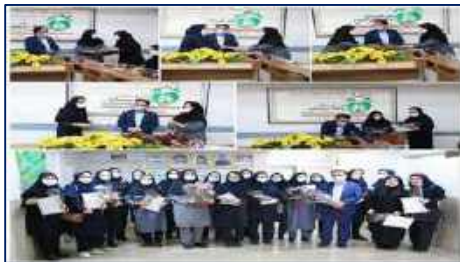
برگزاری مراسم گرامیداشت روز جهانی ماما در شبکه بهداشت و درمان شهرستان گرمسار ۱۴۰۱/۰۲/۲۱