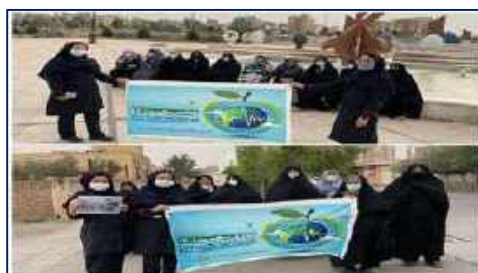
برگزاری همایش پیاده روی و دوستی با طبیعت در مرکز خدمات جامع سلامت شهید نبی اله صفری شهرستان گرمسار ۱۴۰۱/۰۲/۲۱