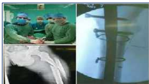
جراحی موفقیت آمیز چهار ساعته جوان ۱۷ ساله در مرکز آموزشی پژوهشی و درمانی کوثر سمنان ۱۴۰۱/۰۲/۲۱