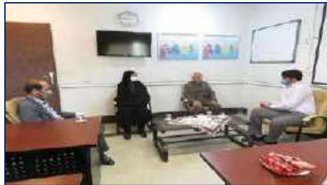
دیدار مدیر کانون خدمت تخصصی سلامت رضوی استان سمنان با سرپرست بیمارستان کوثر ۱۴۰۱/۰۲/۲۸