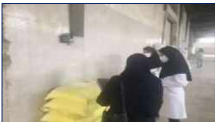
بازدید بازرسان معاونت غذا و دارو دانشگاه علوم پزشکی از کارخانه آرد سمنان ۱۴۰۱/۰۲/۱۲