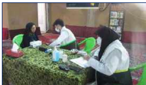
بازدید و تقدیر فرمانده سپاه شهرستان سمنان از تیم جهادی مرکز بهداشت شهرستان سمنان ۱۴۰۱/۰۲/۲۱